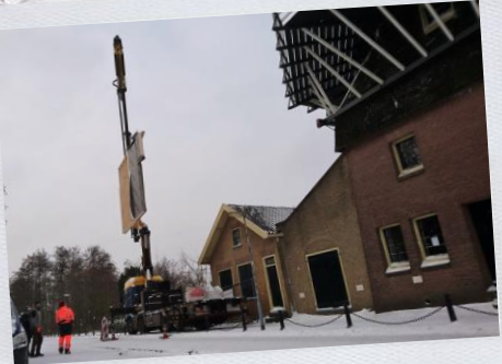
Aanbouw in de meeuw